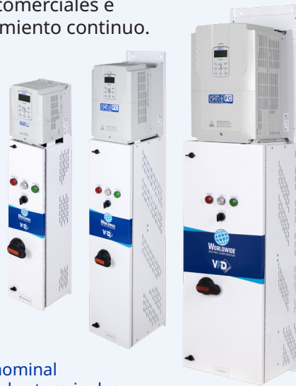
Presentamos el variador de frecuencia World Drive Flex Control

Los paneles de derivación de WorldWide Electric utilizan el fiable variador de frecuencia WorldDrive Flex Control para controlar con precisión y eficacia los motores que accionan equipos como bombas, ventiladores y soplantes en aplicaciones industriales, de fabricación o de climatización comercial. El bypass integrado permite al operador cambiar manualmente al control sin VFD. El funcionamiento en bypass proporciona un funcionamiento fiable para aplicaciones que deben permanecer en funcionamiento, ofreciendo una fiabilidad en la que puede confiar.